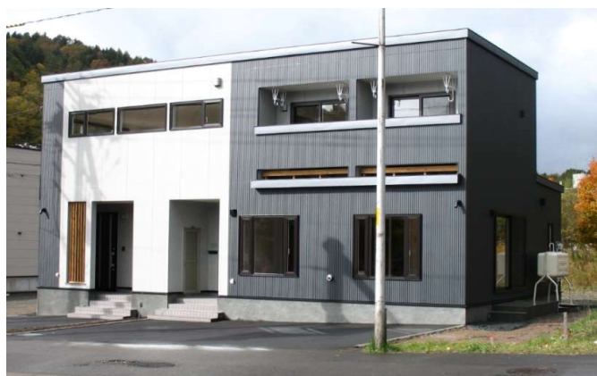
アットホーム・ファクトシート (不動産情報流通システム専用物件資料)