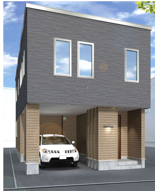
※イメージパースとなります