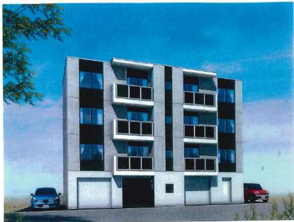
※外観パースはイメージです。実際の仕様とは異なる場合があります。