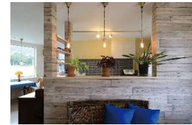
イメージ画像です。