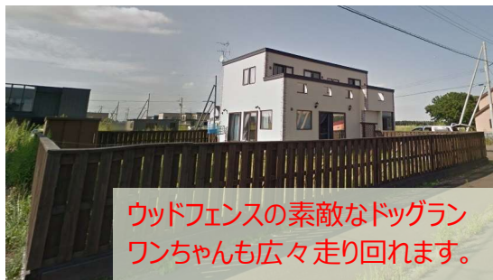
ウッドフェンスの素敵なドッグラン ワンちゃんも広々走り回れます。