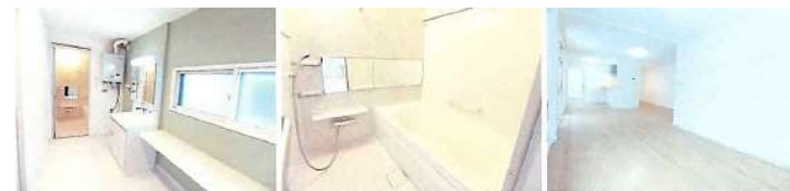
水廻りもきれいで明るい！フローリングもピカピカです。