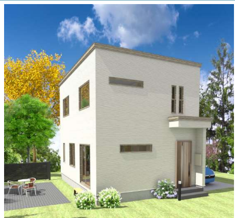
※イメージパースです

●月々63,669円からの家づくり。札幌市手稲区近郊の星野町！収納充実の3LDK