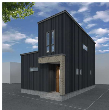
※モデルプラン・イメージパース