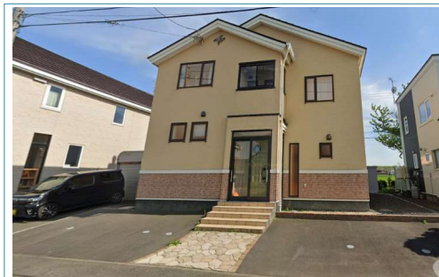
玄関は北側道路に面しています。大型駐車スペース

●「ペットと暮らす家」スキップフロア・大型車含4台駐車可能・敷地内にドッグランも造れます。