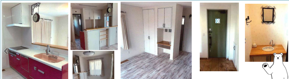
家の向かいには住宅は建たないので眺望がよく、海が近い！ペットとスローライフが楽しめます！