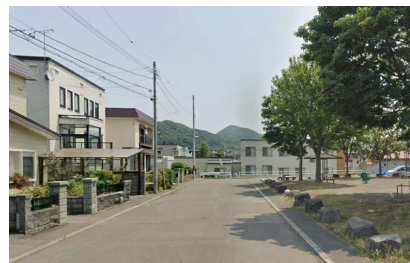
前面道路・向かいには公園があります。