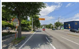
前面道路は 北1条宮の沢通